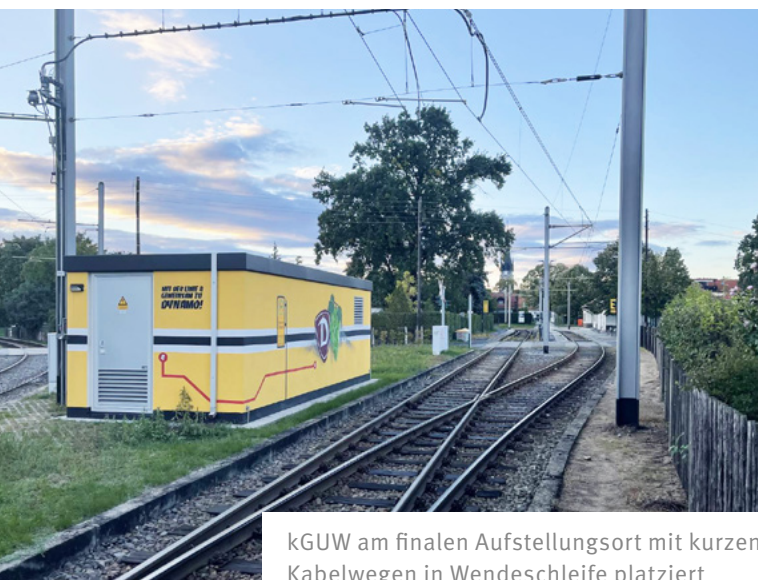
kGUW am finalen Aufstellungsort mit kurzen Kabelwegen in Wendeschleife platziert

Der konstruktive Aufbau gewährleistet hohe Schallisolationenwerte und ermöglicht eine problemlose Aufstellung auch in Wohngebieten. Die Vorgaben der TA Lärm werden erfüllt. Ebenfalls werden die Forderungen der 26. BImSchV für elektrische und magnetische Felder eingehalten.