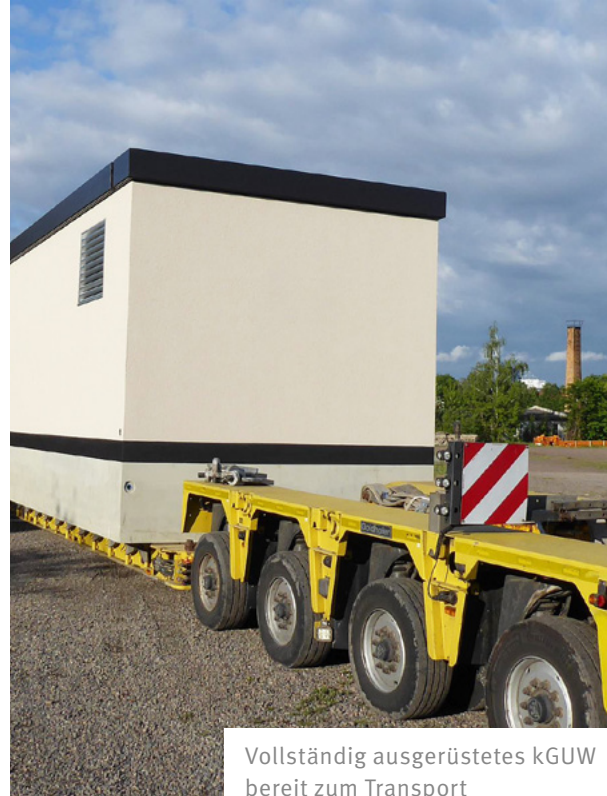
Vollständig ausgerüstetes kGUW bereit zum Transport