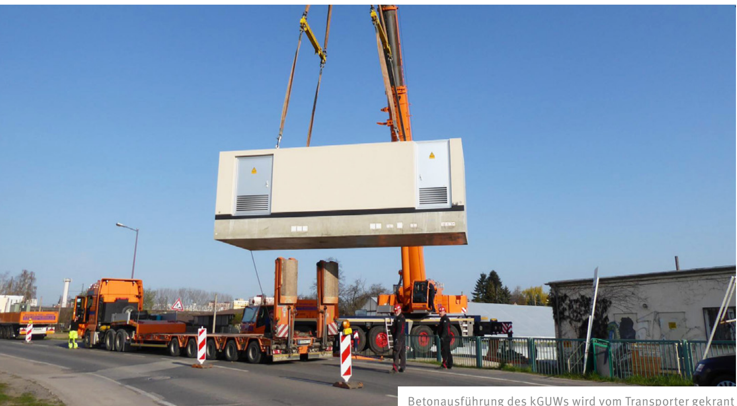
Betonausführung des kGUWs wird vom Transporter gekrant